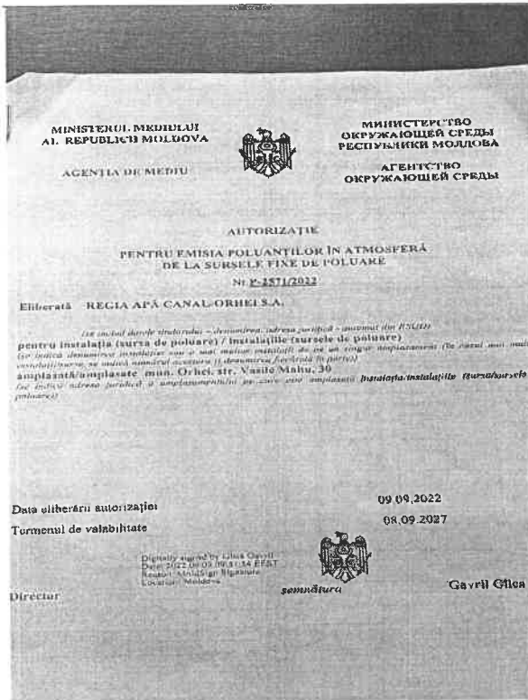
Imaginea nr. 5 Autorizația pentru emisia poluanților în atmosferă mun. mun. Orhei, str.V. Cupcea 5A